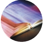
DARLLENWCH Mathew 2: 13-23