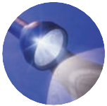
ADNOD ALLWEDDOL 2 Corinthiaid 8:9