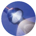
ADNOD ALLWEDDOL Luc 2: 30