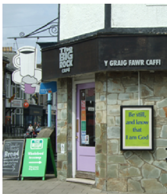
Cristnogion ardal Porthmadog sy'n gyfrifiol am 'The Big Rock Cafe'.