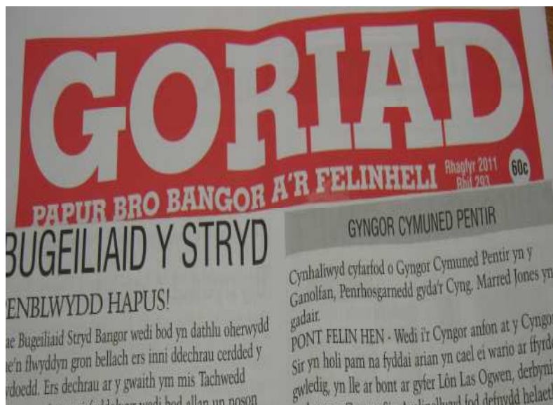
Grŵp o wirfoddolwyr o eglwysi Bangor ydy Bugeiliaid y Stryd. Maent yn mynd allan dros nos i gynnig cymorth i rhywun sydd mewn angen.